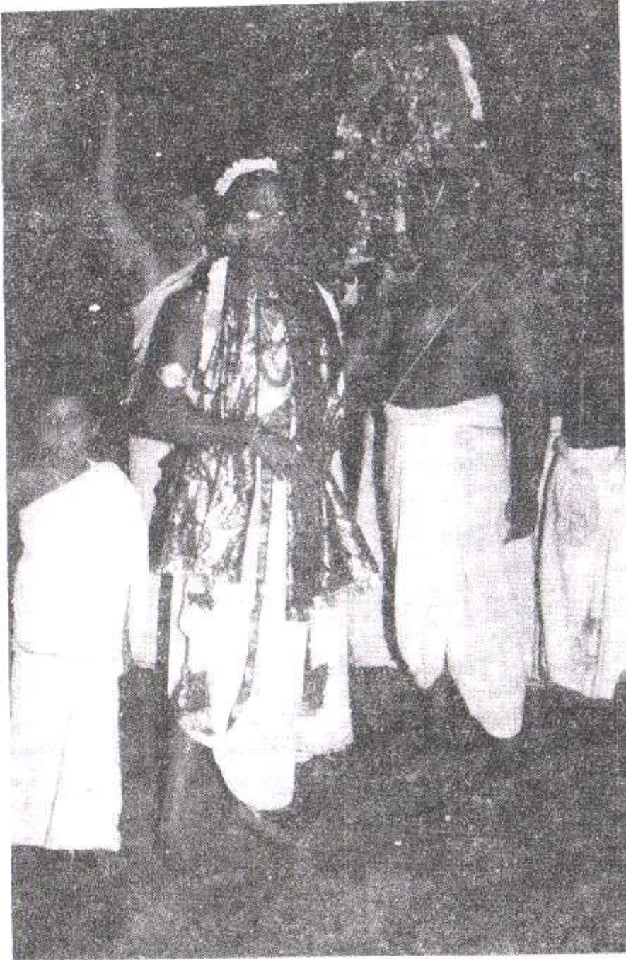
ப்ரம்மோத்சவ வைபவத்தில் ஸ்ரீ திருமங்கை ஆழ்வார் உத்சவத்தன்று ஒரு காட்சி